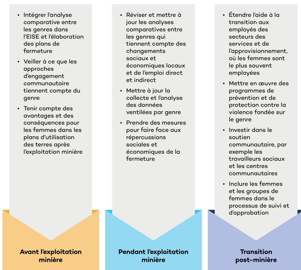
FIGURE 2. Intersection de l'égalité des genres et de la fermeture des mines au cours du cycle de vie de la mine

Malgré le manque d'études publiées, la fermeture des mines et l'égalité des genres se recoupent dans la plupart des activités menées dans le cadre de la planification et de la mise en œuvre de la fermeture. Pour assurer l'égalité des genres dans ces activités de fermeture, les gouvernements et les exploitants de mines devraient mettre en œuvre des processus permettant d'évaluer les besoins et les intérêts de l'ensemble de la communauté et d'y répondre avec équité pour les femmes et les hommes. Cela commence par l'engagement communautaire inclusif et l'ACG et se poursuit jusqu'au soutien social et économique que les exploitants de mines et le gouvernement fournissent aux communautés dans la transition post-minièrre. Les principaux domaines d'intersection entre l'égalité des genres et la fermeture des mines sont examinés ci-dessous et décrits dans la figure 2.